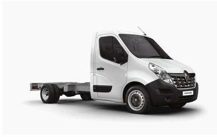
QNG - "Glacier White" valge tavavärv